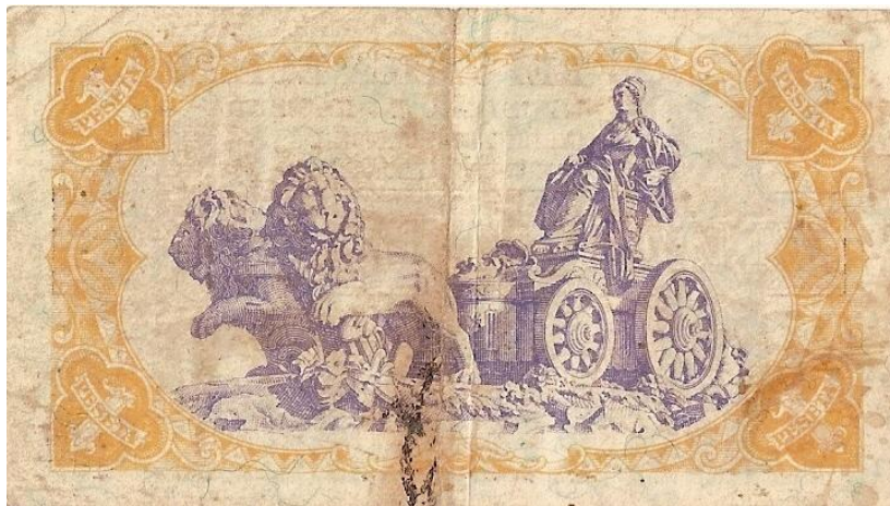
Il·lustració 5. Revers d'un bitllet de la República Espanyola, any 1938.