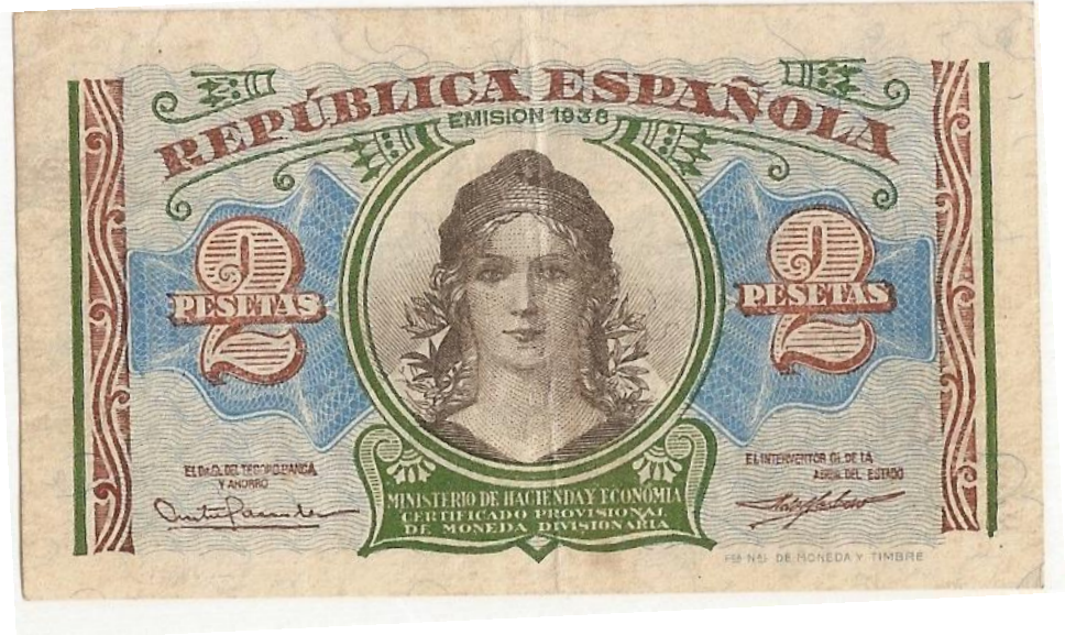
Il·lustració 4. Envers d'un bitllet de la República Espanyola de l'any 1938.